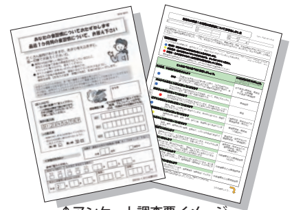
↑アンケート調査票イメージ

1日あたり何gの食塩を摂取しているかを尿から測定する<郵送検査>です。また、食塩摂取量目標と比べたときの評価、全国平均を踏まえたレベル判定も検査結果としてお返しします。